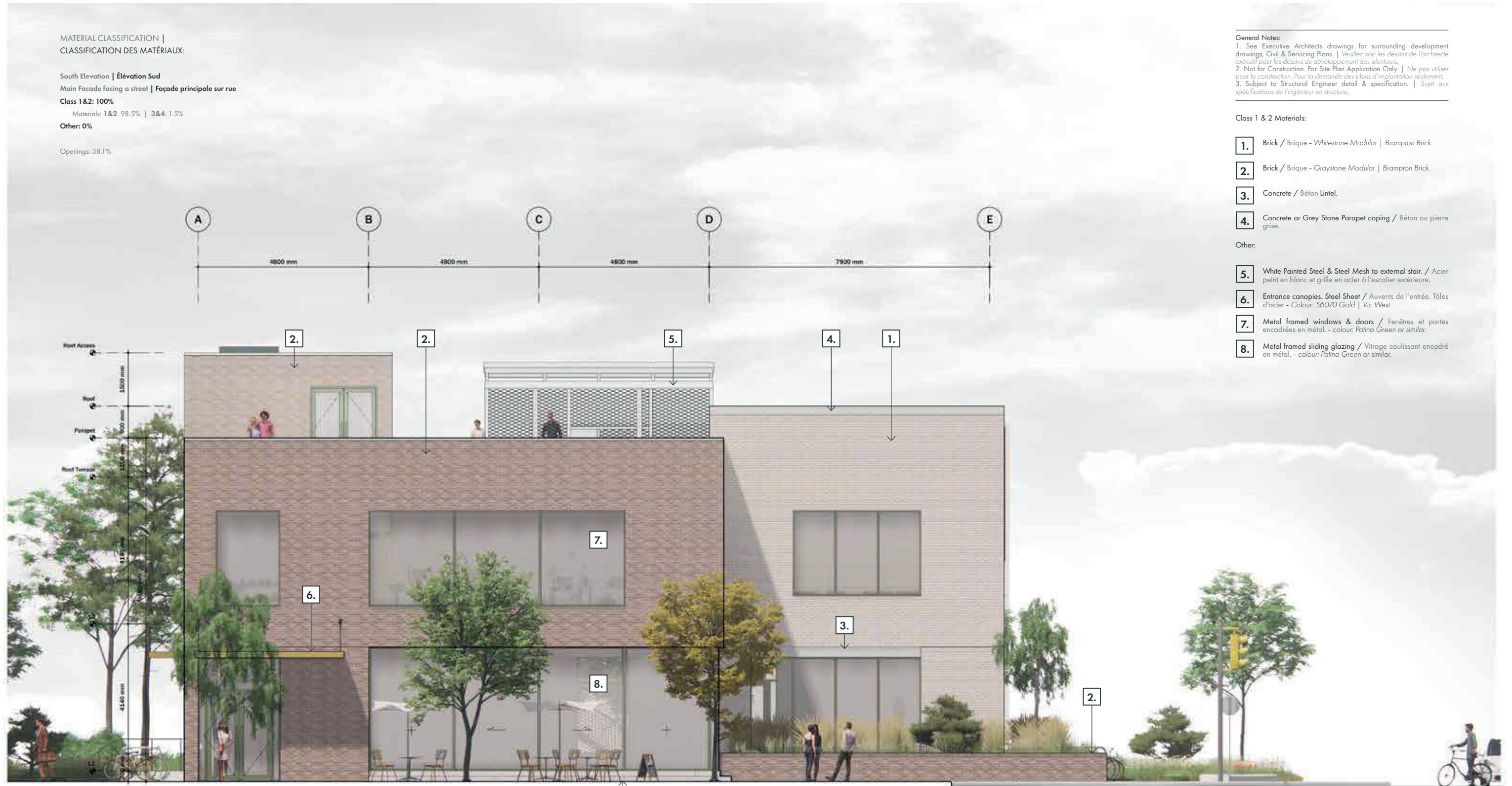
South Elevation-1:100 @ Tabloid