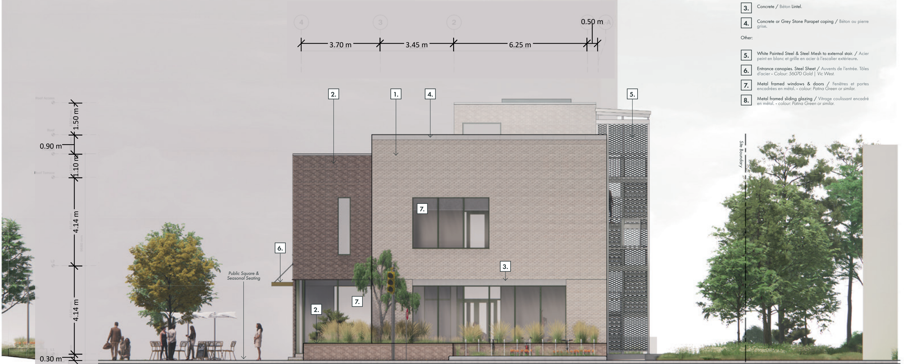
East Elevation-1:100 @ Tabloid

The East Elevation forms the gateway to the site from the access road, with the secondary volume clad in the lighter brick relating to the ORA opposite. This is set back behind a raised brick planter, with an asymmetric arrangement of openings and the striking raised window to the Library in the corner.