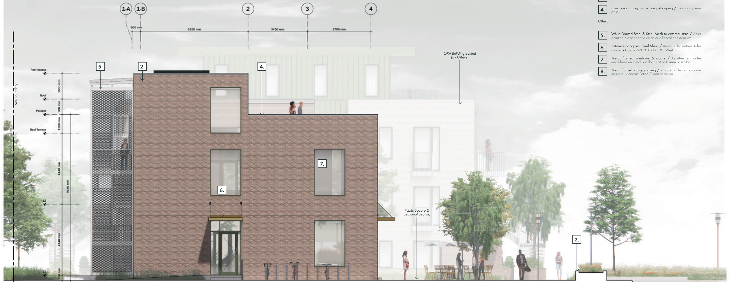
West Elevation- 1:100 @ Tabloid

The West Elevation faces the Lucerne building. Glazing here is restricted to the main entrance & Gym above (right) and the side entrance and circulation spaces on both floors and the roof access - providing views through the building to create a sense of spaciousness and connectivity to the surrounding development.